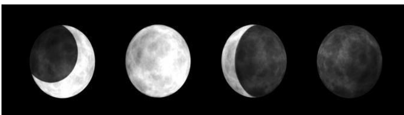
As quatro fases da Lua vista do hemisfério sul: minguante, cheia, crescente e nova.

A Lua não tem luz própria, entretanto, conseguimos vê-la brilhante pois, ela reflete a luz proveniente do Sol. A Lua apresenta três movimentos principais: rotação (em torno do seu próprio eixo), revolução (ao redor da Terra) e translação (ao redor do Sol), junto com a Terra. Assim, de acordo com a sua posição em relação ao Sol e a Terra, a veremos iluminada de diferentes maneiras, chamadas de fases da Lua.